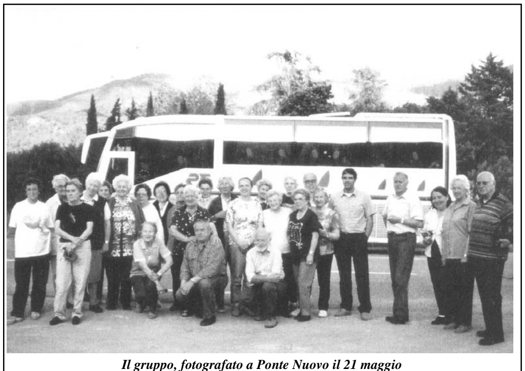
Il gruppo, fotografato a Ponte Nuovo il 21 maggio

In conclusione, un viaggio davvero interessante, per merito dell'organizzatore-guida, dell'autista, dei compagni di viaggio e delle splendide visioni isolane.